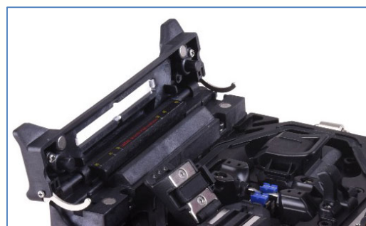
Время усадки -15 с