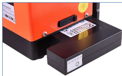
Емкость батареи -5200мАч